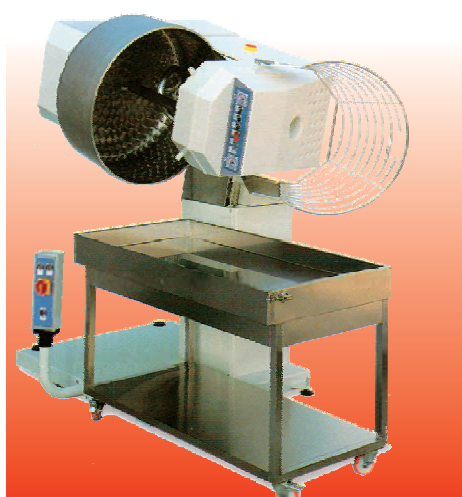
Dough capacity: 130~250 Kg