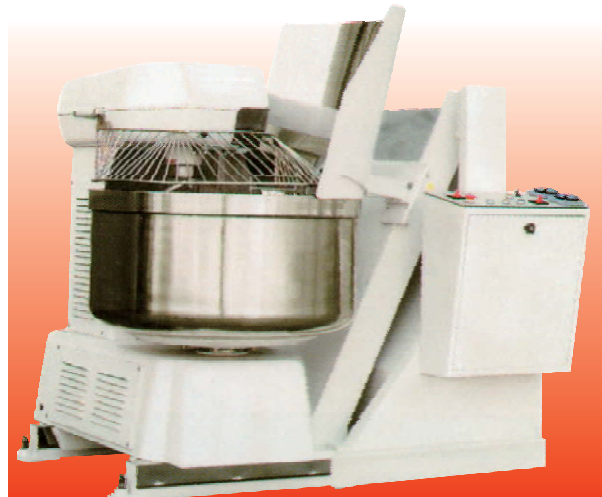
Dough Capacity: 300kg